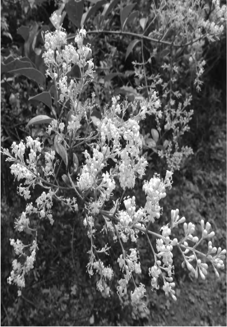
रानसुगंध पसरवणारी कुंजणची फुलं