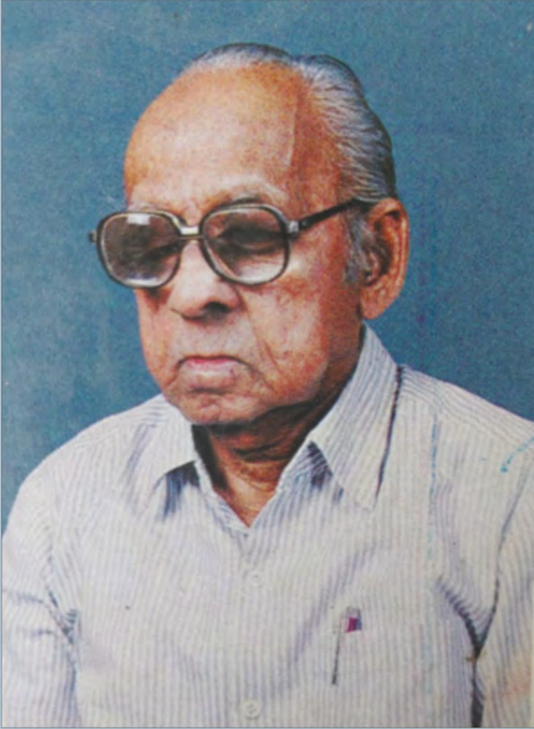
कविवर्य शंकर रामाणी (जून २०२१-२२ जन्मशताब्दी वर्षानिमित्त)